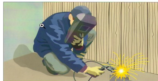
Нарушение правил проведения сварочных работ

На успешное тушение пожара и спасение людей, находящихся в горящем здании влияют следующие основные факторы: